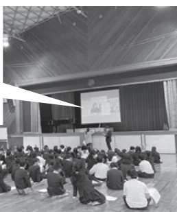
●学校の別室と体育館でリモートで行われました。