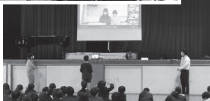
●学校の別室と体育館でリモートで行われました。